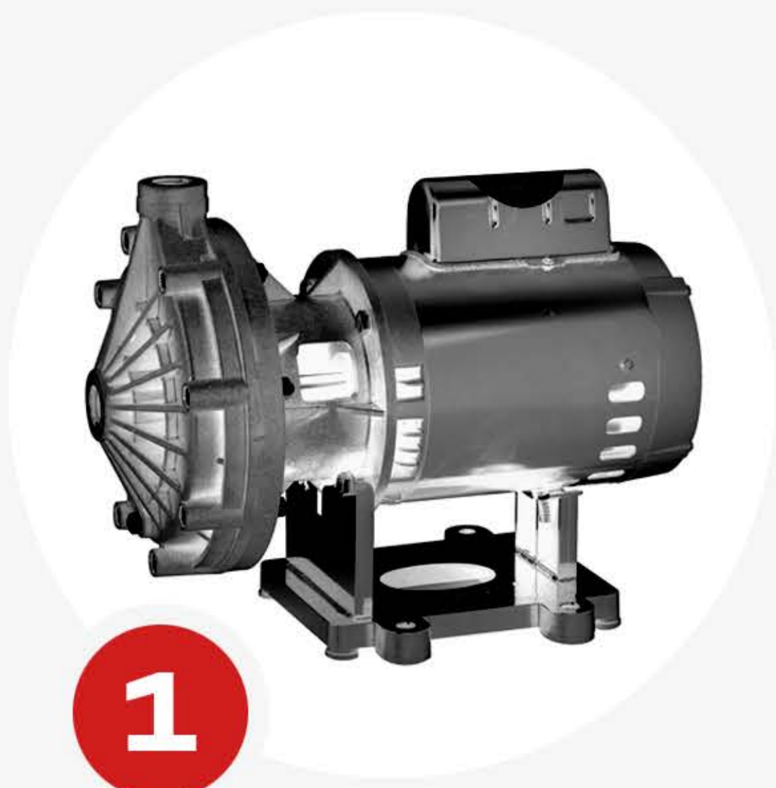
1 VALITAAN KOHDE

IRIS M -suurnopeuskamera mittaa pienimmätkin värähtelyt ja vahvistaa ne, jolloin kappaleen liikkuminen voidaan helposti nähdä mittavideon avulla.