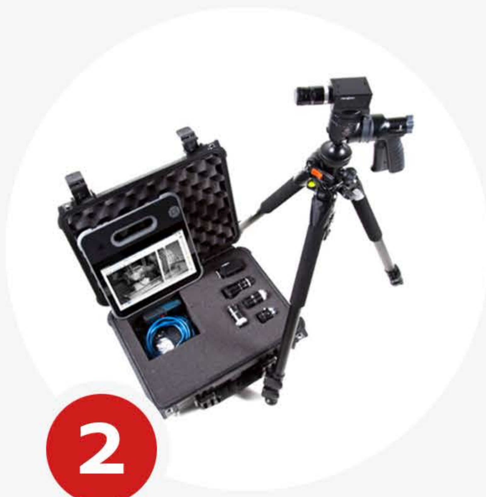
2 KOHTEEN KUVAUS